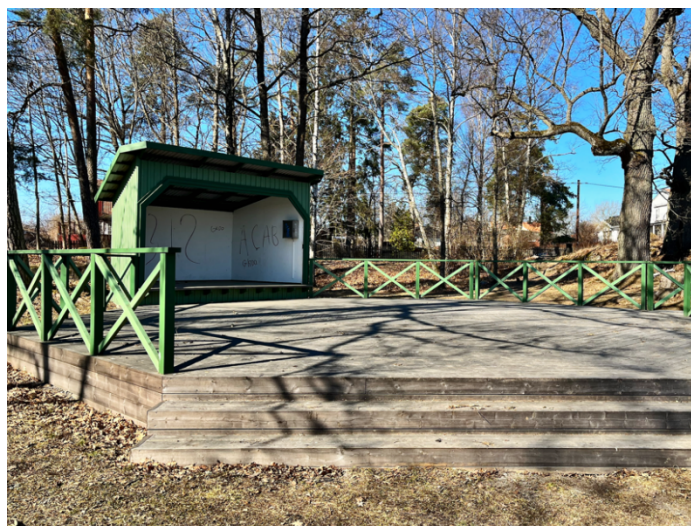
Exempel på dansbana vid Herrängens gård.

Förvaltningen tackar för förslag till aktivering runt Axelsberg. Förvaltningen har undersökt platsen och har kunnat konstatera att den förslagna ytan är för liten för en dansbana. Dessutom är det förslagna platsen belägen när bostadshus som riskerar att bli störda av musik. Däremot tar förvaltningen med sig önskemål om en dansbana på någon annan plats.